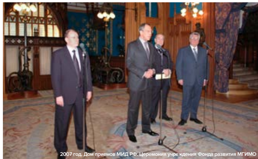
2007 год. Дом приемов МИД РФ. Церемония учреждения Фонда развития МГИМО

выпускники, напрямую использовать нельзя — только проценты, полученные от размещения денег и управления ими. Средства фонда инвестируются на фондовом рынке, генерируя постоянный прирост. Финансирование программ МГИМО происходит за счет инвестиционного дохода, а сам капитал остается неприкосновенным.